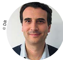
Par Baptiste Coupin

Ce numéro comporte un tiré à part Cybersécurité