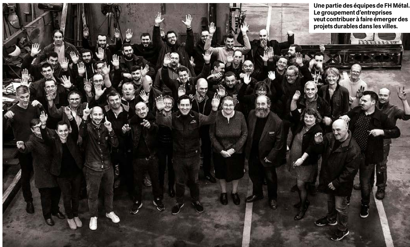
Une partie des équipes de FH Métal. Le groupement d'entreprises veut contribuer à faire émerger des projets durables dans les villes.